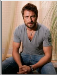
L'acteur Gerald Butler a fait faux bond aux producteurs du 'remake' du film «Escape From New York».

L'acteur Gerald Butler a fait faux bond aux producteurs du 'remake' du film «Escape From New York» rapporte Variety. Butler a décidé de faire marche arrière avant le tournage du film. L'acteur cite des «différends créatifs» avec les producteurs pour expliquer son abandon.